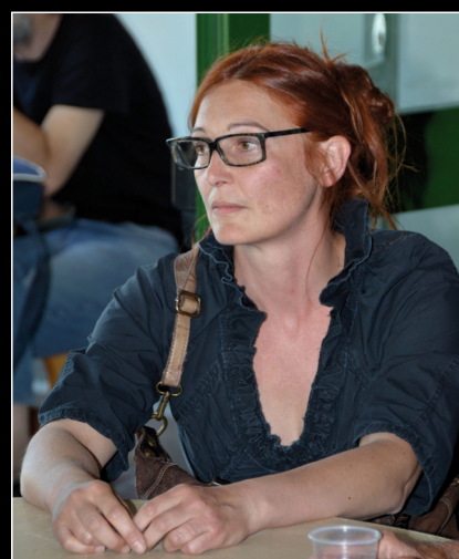
Documentario "Nel segno del Capro", la regista Fabiana Antonioni